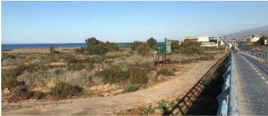
Delta del río Andarax con carácter previo al desarrollo de la presente Buena Práctica