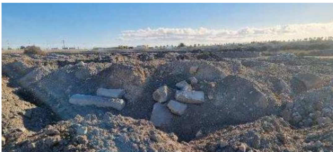
Delta del río Andarax con carácter previo al desarrollo de la presente Buena Práctica

De igual forma, entre los objetivos a perseguir por parte de la actuación se encontraba el de mejorar los parámetros de sostenibilidad urbana que influyen en la calidad de vida del territorio, mejorando el atractivo y valor ambiental de las zonas objeto de intervención y mejorando los espacios de transición existentes entre las zonas residenciales e industriales.