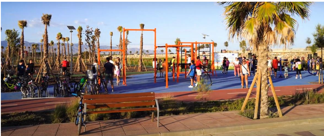
Delta del río Andarax tras la realización de la presente Buena Práctica

Tal y como se muestra en las imágenes expuestas con anterioridad, los objetivos inicialmente planteados han sido ampliamente conseguidos, puesto que, gracias a la regeneración y conservación de las especies vegetales emplazadas en el delta, la creación de un nuevo Paseo de