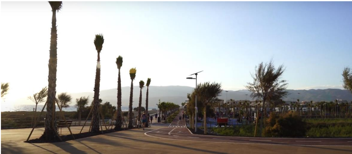
Delta del río Andarax tras la realización de la presente Buena Práctica